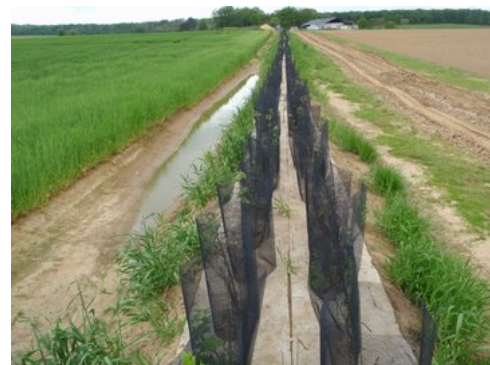
Plantations mars 2009 où le fossé est déjà efficace!

D'autres plantations pour préserver la biodiversité ont été effectuées en associant agriculteurs, sociétés de chasse, habitants, parents, enfants au printemps 2009.