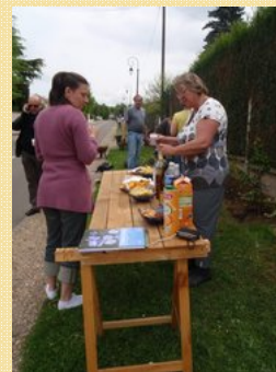
Permettent de rassembler les participants