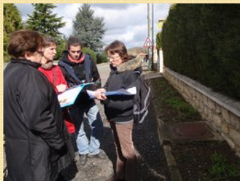
En mars, conception des massifs

Deux samedis sont consacrés à l'opération : un pour choisir les végétaux et composer les massifs sur le terrain en mars et un pour effectuer les plantations en mai. Ces journées particulières sont aussi l'occasion de partager un moment convivial !