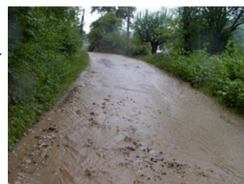
Dégâts des orages mai 2008

Pour lutter contre ces phénomènes, la municipalité a monté un projet de plantations de haies champêtres en partenariat avec le PNR du Vexin français et les agriculteurs concernés. Ce projet monté en 2008 a vu son aboutissement en mars 2009 avec la réalisation des plantations par une association d'insertion VIEVERT.